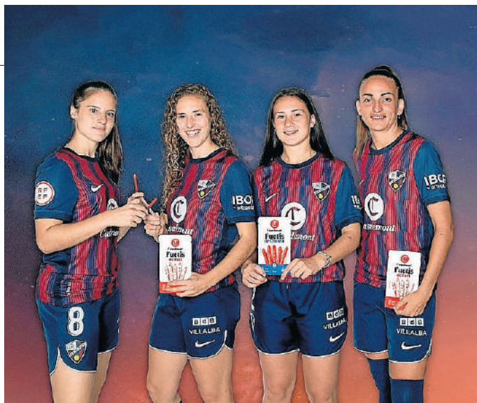
Casademont es el esponsor principal del primer equipo.