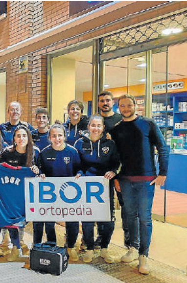
Ortopedia Ibor, un apoyo desde el principio.