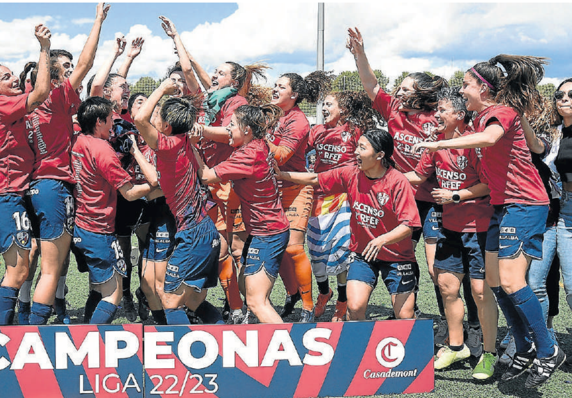
Las jugadoras del primer equipo celebran el ascenso sobre el césped de San Jorge.