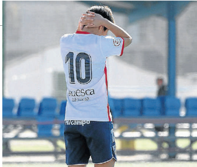
Huesca La Magia, Alcampo y Podoactiva, comprometidos.

apoyar al femenino, cuando empezó. Es una experiencia muy gratificante, porque lo hemos visto crecer. Sentimos un cariño especial y son una gente estupenda. Como empresa oscense, además, supone una visibilidad y algo que nos identifica”.